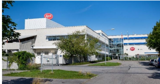
Fabriken i Älvsjö

Stiftelsen är ensamägare av Kavlikoncernen och delar av vinsten från företaget går årligen till Kavlifonden och dess allmännyttiga verksamhet.