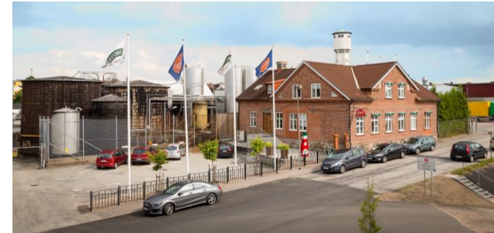
Fabriken i Eslöv

Kavli Sverige har idag fabriker i Eslöv och i Älvsjö, där även Huvudkontoret ligger.