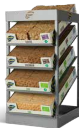
Delbart två- eller fyrvåningsställ Tvävåning: HxBxD 360x400x550 mm Fyrvåning: HxBxD 590x400x550 mm