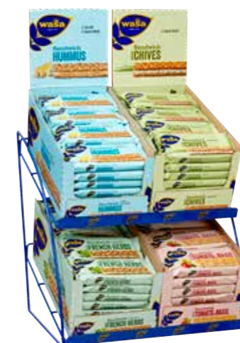
Bordställ h420xb340xd330 mm

Två färdiga smörgåsar med med fyllning mellan dubbla knäckemackor av veteknäckebröd. Innehåll: Vetemjöl 58%, vegetabilisk fett (raps, shea), ostpulver 9,0%, maltodextrin, kärmjölkspulver, jäst, socker, arom (mjölk), salt, torkad tomat 0,7%, torkad basilika 0,02%. Kan innehålla spår av sesamfrön, soja och lupin.