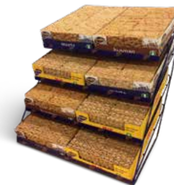
Fyrvåningsställ HxBxD 480x486x470 mm