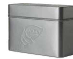
Metallburk HxBxD 139x200x88 mm