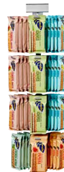
Hörnställ med magnet h613xb330xd195 mm