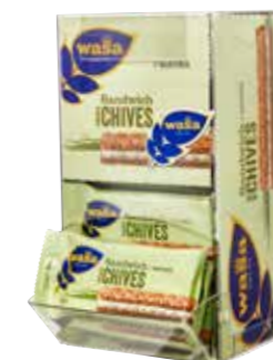
Plexiställ med magnet h295xb164xd195 mm