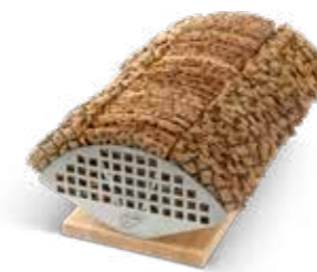
Trekantställ HxBxD 132x232x410 mm