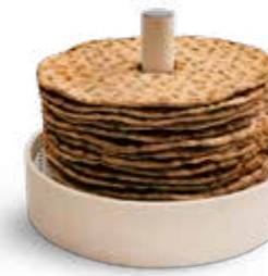
Trästall för mellanrunda DxH 208x160 mm